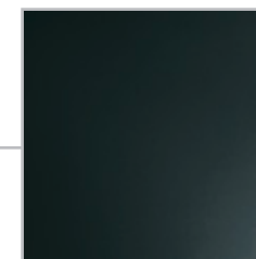
Musta (vain ohjaamo)