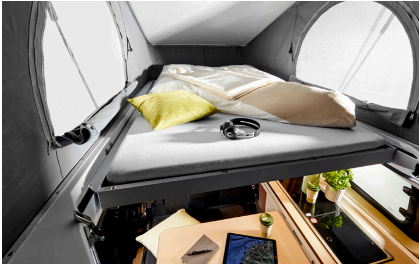
Techo abatible de serie con cama doble grande. Las aberturas y las mosquiteras brindan claridad y protegen contra los insectos.