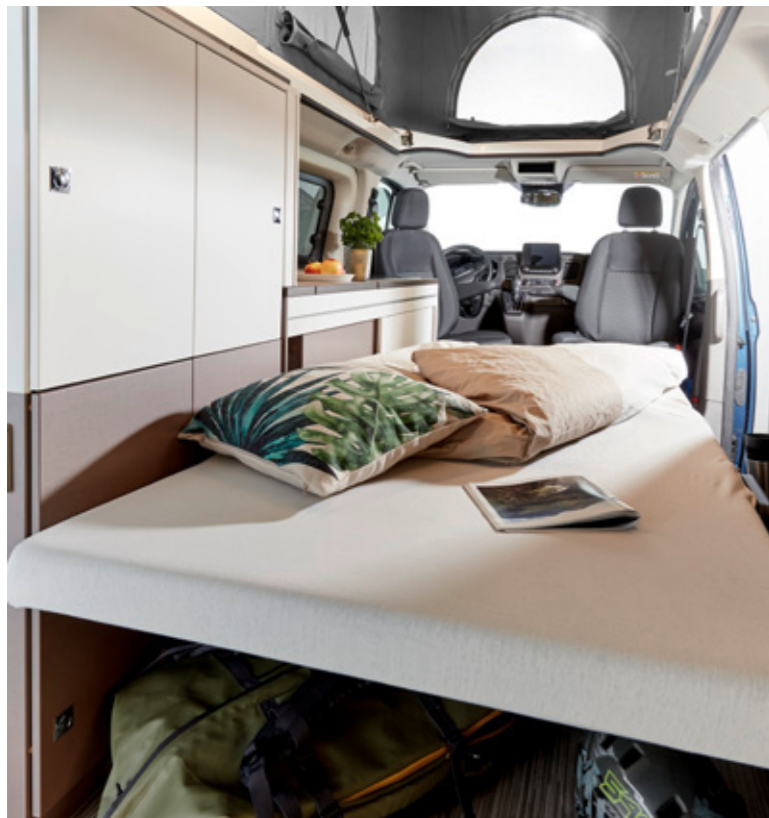
La Copa está equipada con un asiento posterior que puede transformarse en una cama para dos personas. Con la cama doble en el techo abatible, por lo tanto, permite que cuatro personas pasen la noche tranquilamente.