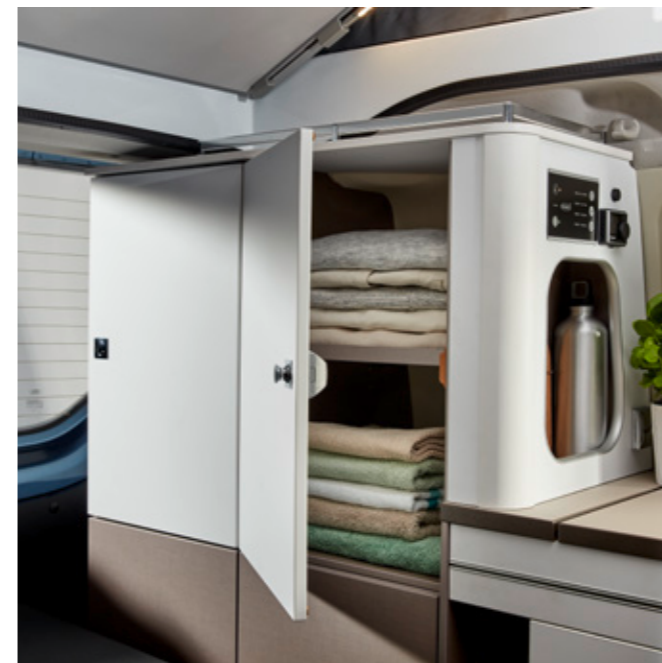
Además, espacios de almacenamiento adicionales para ropa u otros accesorios para las vacaciones.