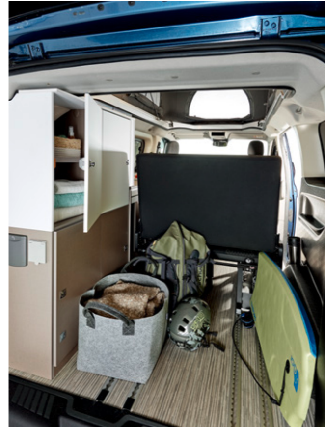
La zona posterior ofrece una amplia superficie de carga.